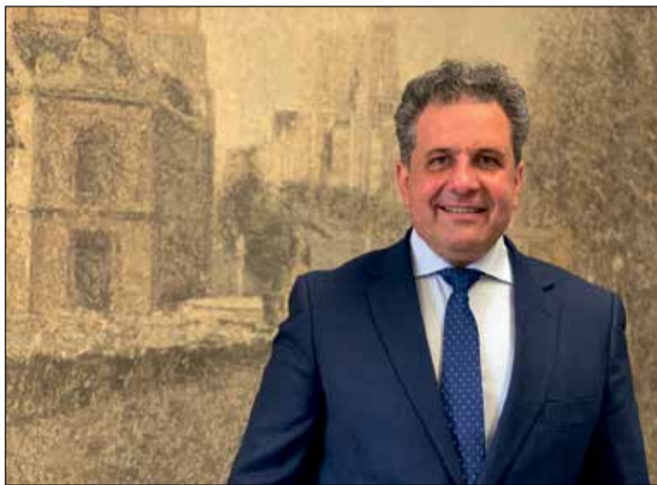
Ramón Jurado, alcalde de Parla

Respuesta: No solo a los vecinos, también a los comerciantes. El centro estaba totalmente degradado y había que cambiar la imagen de la ciudad con una peatonalización, porque eramos la única ciudad de más de 100.000 habitantes que no tenía una zona para el paseo, una zona peatonal que también beneficia al comercio. Un ambicioso proyecto que va a suponer peatonalizar las grandes zonas de comercio local y que supone un cambio radical para los ciudadanos. Se entiende que durante el periodo de obras se producen ciertas incomodidades como es lógico, pero ahora está empezando a dar resultado y está suponiendo que los comercios estén contentos con cómo se está desarrollando la ciudad y están viendo que antes de que estén acabadas las obras hay mucha gente que pasea por las puertas de sus comercios. Se ha recuperado la antigua biblioteca que se ha convertido en una sala de exposiciones, se han demolido las antiguas ruinas de la casa cuartel de la Guardia Civil y se ha embellecido mucho el centro de la ciudad, y eso anima